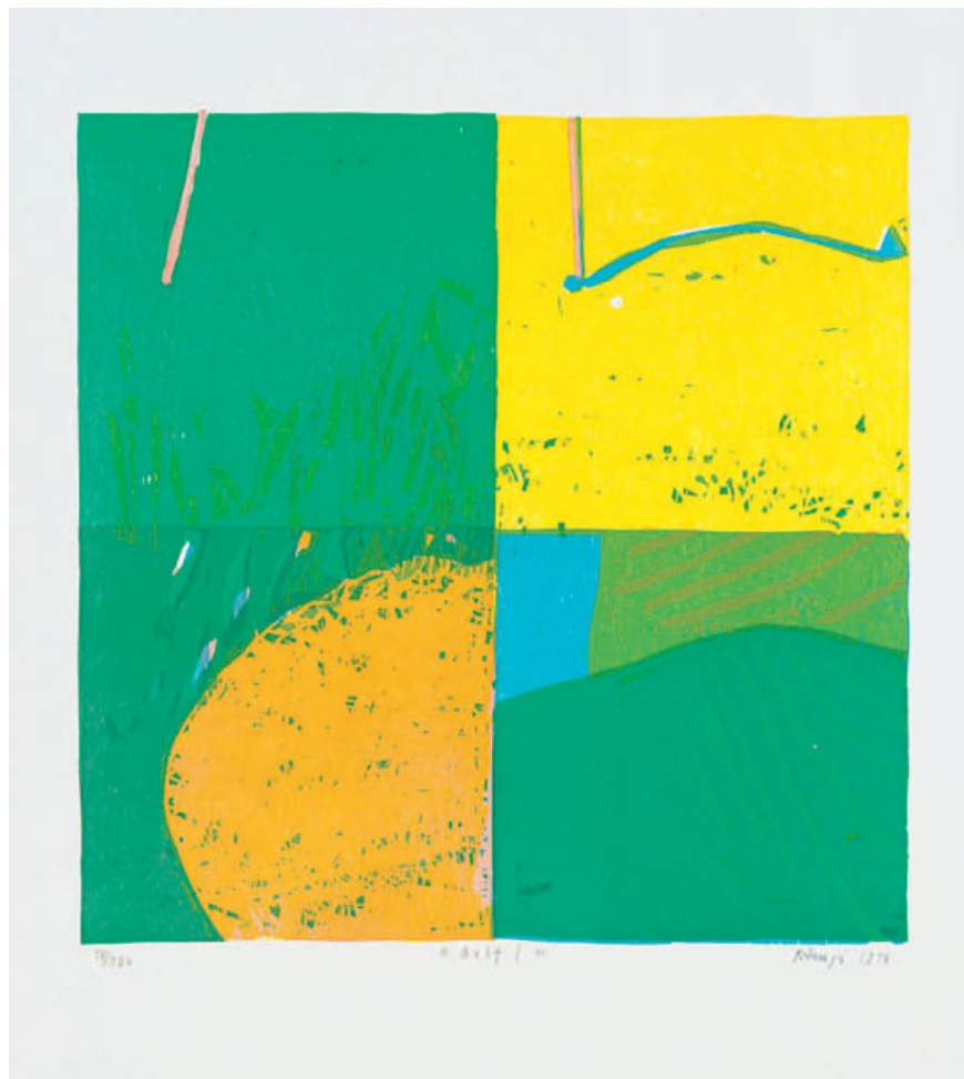
Künstler Rudolf Küenzi, Schweiz Titel Golf 1, No. 001 Drucktechnik Originalgrafik, Holzschnitt 4-farbig Auflage 250 Ex., handsigniert und numeriert Papier Echtbüttenkarton 50 x 65 cm