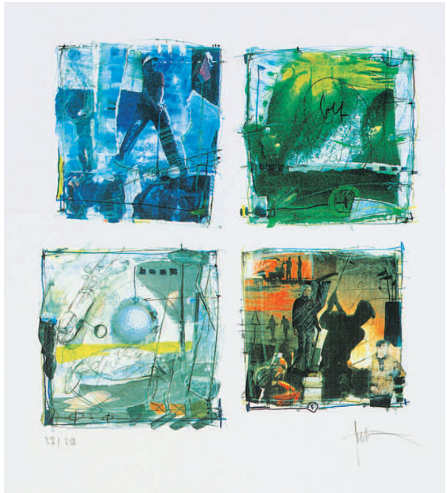
Künstler Peter Möhrle, Deutschland Titel Komposition, No. 002 Drucktechnik Originalgrafik, Serigrafie 4-farbig Auflage 250 Ex., handsigniert und numeriert Papier Echtbüttenkarton 50 x 65 cm