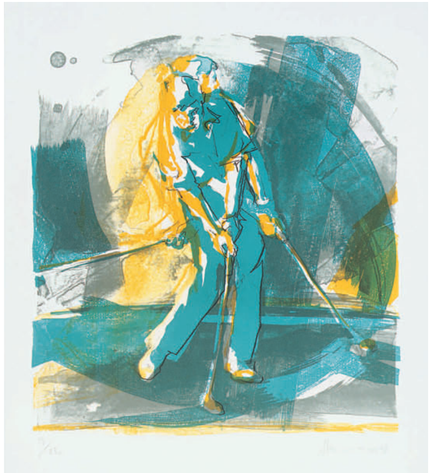
Künstler Peter Steinmann, Schweiz Titel Swing, No. 004 Drucktechnik Originalgrafik, Stein-Lithografie 4-farbig Auflage 250 Ex., handsigniert und numeriert Papier Echtbüttenkarton 50 x 65 cm