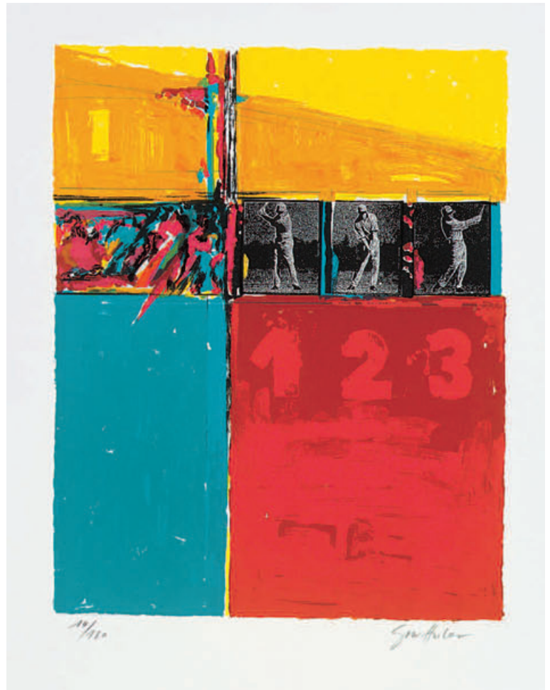
Künstler Giovanni Huber, Schweiz Titel Perfect, No. 010 Drucktechnik Originalgrafik, Stein-Lithografie 7-farbig Auflage 120 Ex., handsigniert und numeriert Papier Echtbüttenkarton 50 x 65 cm