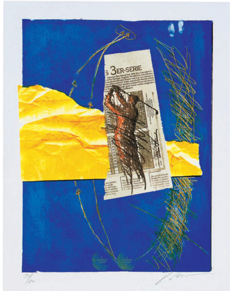
Künstler Rolf Ziegler, Schweiz Titel Blue, No. 009 Drucktechnik Originalgrafik, Stein-Lithografie 9-farbig Auflage 120 Ex., handsigniert und numeriert Papier Echtbüttenkarton 50 x 65 cm